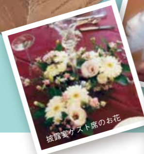
披露宴ゲスト席のお花