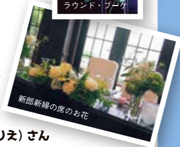
新郎新婦の席のお花