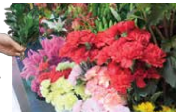
店主好みの“ばきっとした花”がたくさん。

家業の花店で働き始めて21年。店主、商店街の理事長、ふたりのこどもの母として奮闘する毎日。フラワーコーディネーター、カラーコーディネーターの資格を持つ。アレンジメントには定評があり、リピーターも多い。