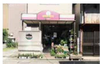
きれいな花に通りに行く人が足を止めます。

創業から60年余り。店頭で季節の草花の小鉢を並べ、朝夕の通行人もときおり足を止める。ご近所の方が利用するまちの花屋さんであるが、長持ちするお花を提供するなどの誠実な仕事ぶりで地元の人から信頼されています。