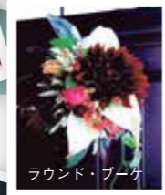
ラウンド・ブーケ