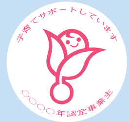
【次世代認定マーク くるみん】

認定企業になると、 次世代認定マーク（愛称：くるみん） を商品等につけることができ、企業のイメージアップや優秀な人材の確保等が期待できます。