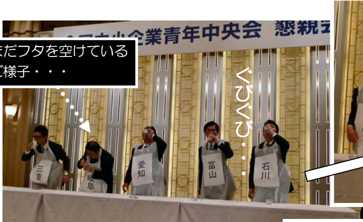
全国・牛乳早飲み大会