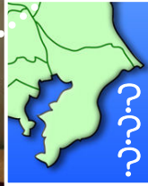
横から見ると 千葉県形のらしい・・・