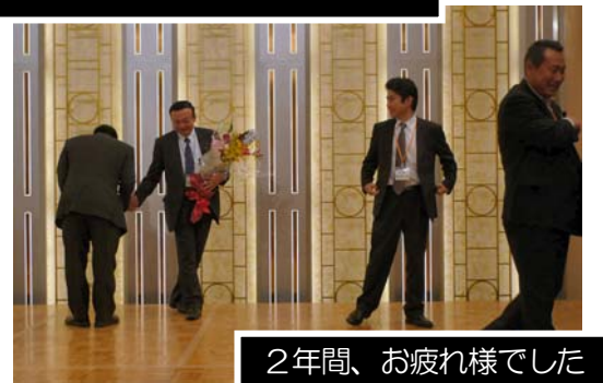
2年間、お疲れ様でした