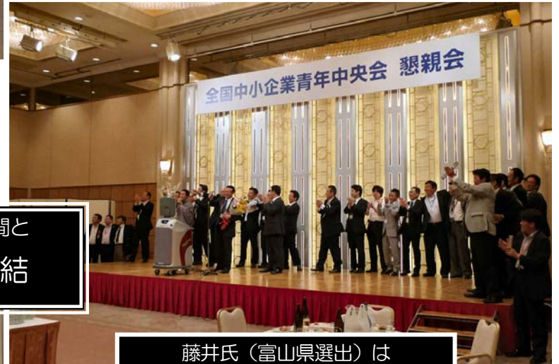
藤井氏（富山県選出）は 今期で全国会長を退任されました