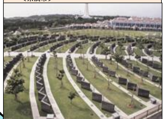
(視察先)【沖縄県営平和祈念公園】<糸満市>