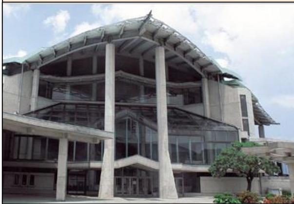
(全国大会会場)【沖縄コンベンションセンター】<宜野湾市>