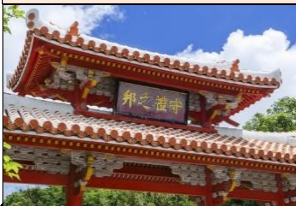
(視察先)【首里城公園】<那覇市>