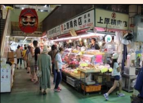
(視察先)【第一牧志公設市場】<那覇市>